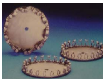
Pour IC 3452/80

IC3410/40 Portoir central échantillons avec 104 clips pour tubes de Ø 8-12mm