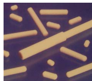
IC1820/80 5 barreaux 20x8mm

IC3400/50 20 clips pour tubes de Ø 37-45mm